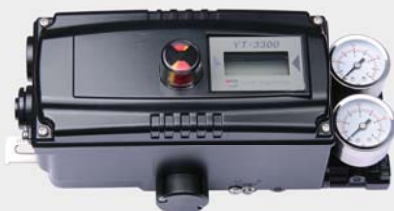
YT-3300R + 限位开关